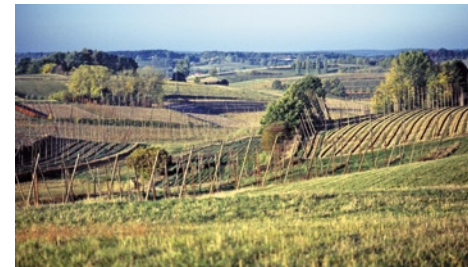
Hügellandschaft der durch Hopfenanbau bekannten Hallertau

Das Tertiärhügelland besteht aus Molasse (französisch-schweizerisch: sehr weich). Sie entstand, als sich der Trog nördlich der Alpen mit dem Abtragungsschutt der aufsteigenden Alpen füllte. Vornehmlich Kies, Sand und Ton prägen den Untergrund. Während der Eiszeiten lagerte sich auch Löss ab – ein eingewehter Gesteinstaub.