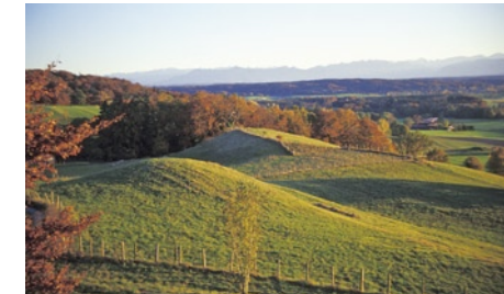
Moränenlandschaft bei Herrsching

Das Voralpenland wurde mehrfach durch weit ins Vorland reichende Gletscher und deren Schmelzwässer modelliert. So entstanden eiszeitlich geprägte Landschaftsformen wie z. B. Grundmoränen, Moränenwälle, Toteiskessel, Drumlins und großflächige Schotterfluren.